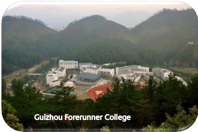
Guizhou Forerunner College