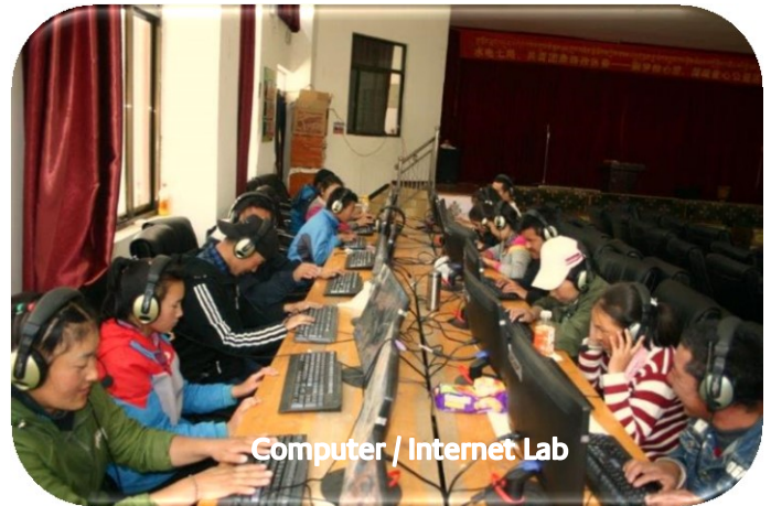
Computer / Internet Lab