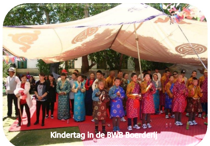
Kindertag in de BWB Boerderij